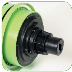
Kopf mit Schaumhemmsystem.