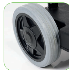
Fahrgestell mit groß bemessenen Hinterrädern, für eine bessere Lenkbarkeit.