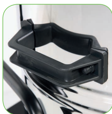
Mit Edelstahlbehälter und seitlichen Griffen zum leichteren Entleeren des Behälters.