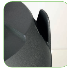
Kopf mit Kabelhaken.