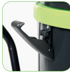
Kunststoffteile aus hochfestem und vollständig recycelbarem Polypropylen.