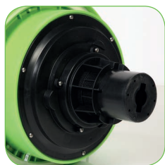
Kopf mit Schaumhemmsystem.