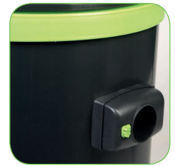
Behälter aus extrem stoßfestem, verschleißfestem und leicht zu reinigendem Polypropylen.