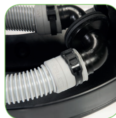
Serienmäßig integrierter Ablassschlauch zum leichten Entleeren des Behälters.