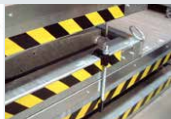
[ 7 ] Verbindungsklammern