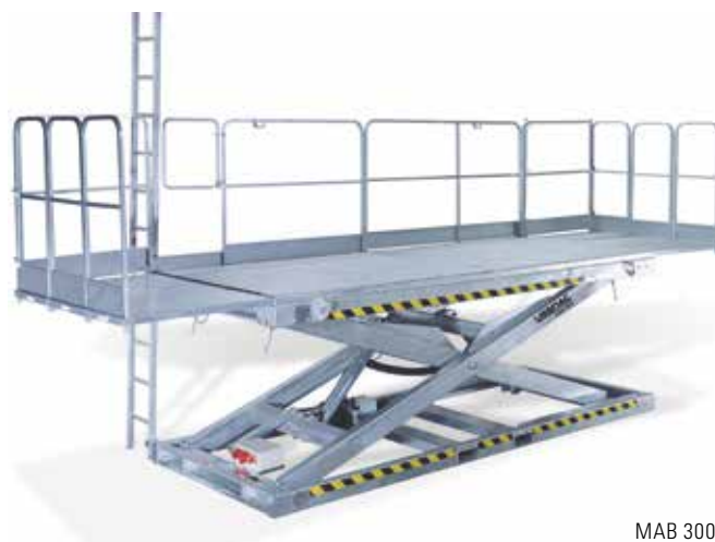
MAB 3002 Abb. inkl. Geländer und Leiter mit Befestigung

Wir weisen ausdrücklich darauf hin, dass gemäß Maschinen-Richtlinie 2006/42/EG ausnahmslos alle Maurerarbeiten nur mit Geländer eingesetzt werden dürfen.