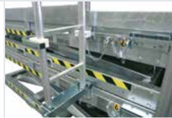
[ 3 ] Leiter Adapter-Satz