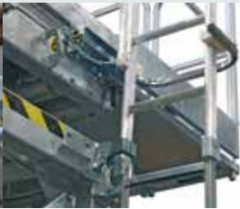
[ 2 ] Leiter mit Befestigung