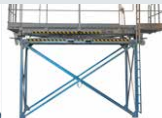
[ 6 ] Untergestell + Verbindungsstreben