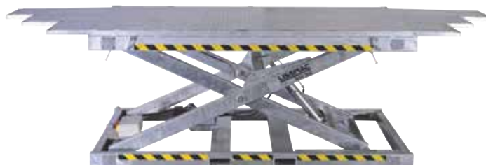
MAB 2002 / 2802

Wir weisen ausdrücklich darauf hin, dass gemäß Maschinen-Richtlinie 2006/42/EG ausnahmslos alle Maurerarbeiten nur mit Geländer eingesetzt werden dürfen.