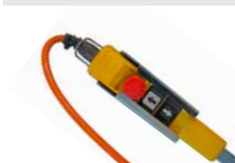
[ 5 ] Handsteuergerät