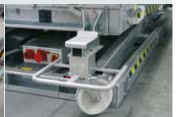
[ 8 ] Radsatz