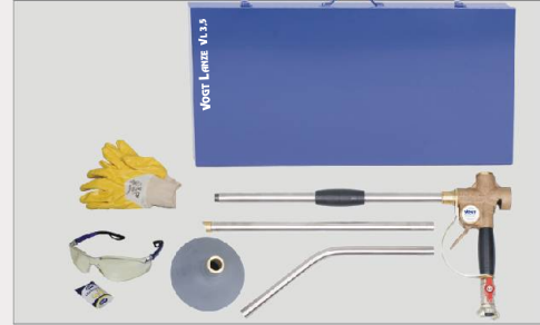
VOGT Lanze Grundausstattung