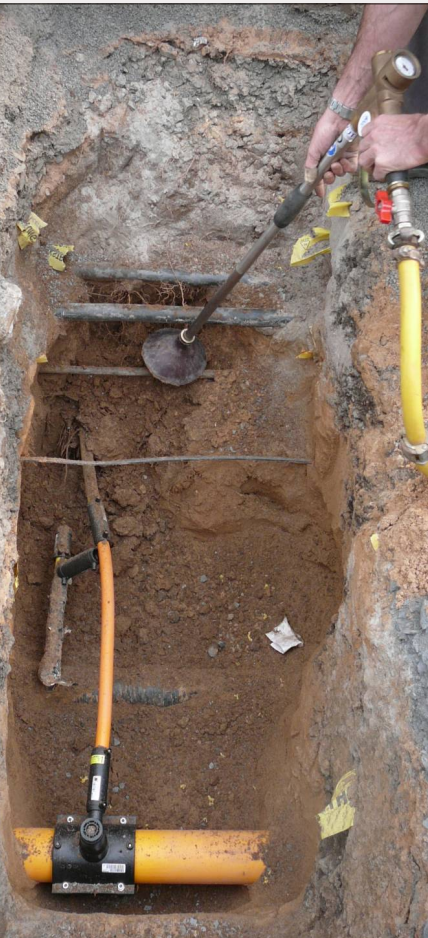
Unterminieren für Anschlussarbeiten