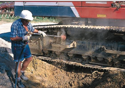
Reinigen von Baumaschinen