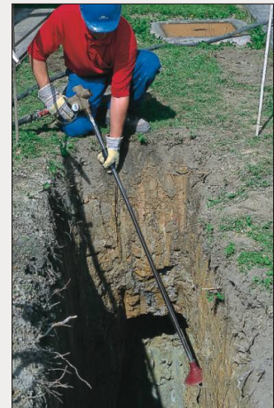
Arbeiten mit Verlängerungsrohr